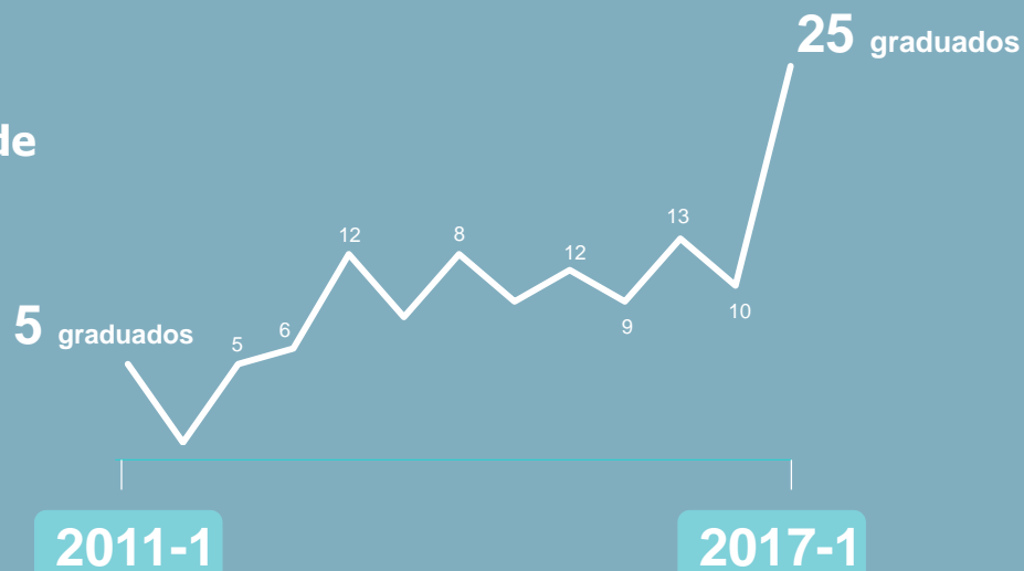
Gráfica crecimiento de egresados